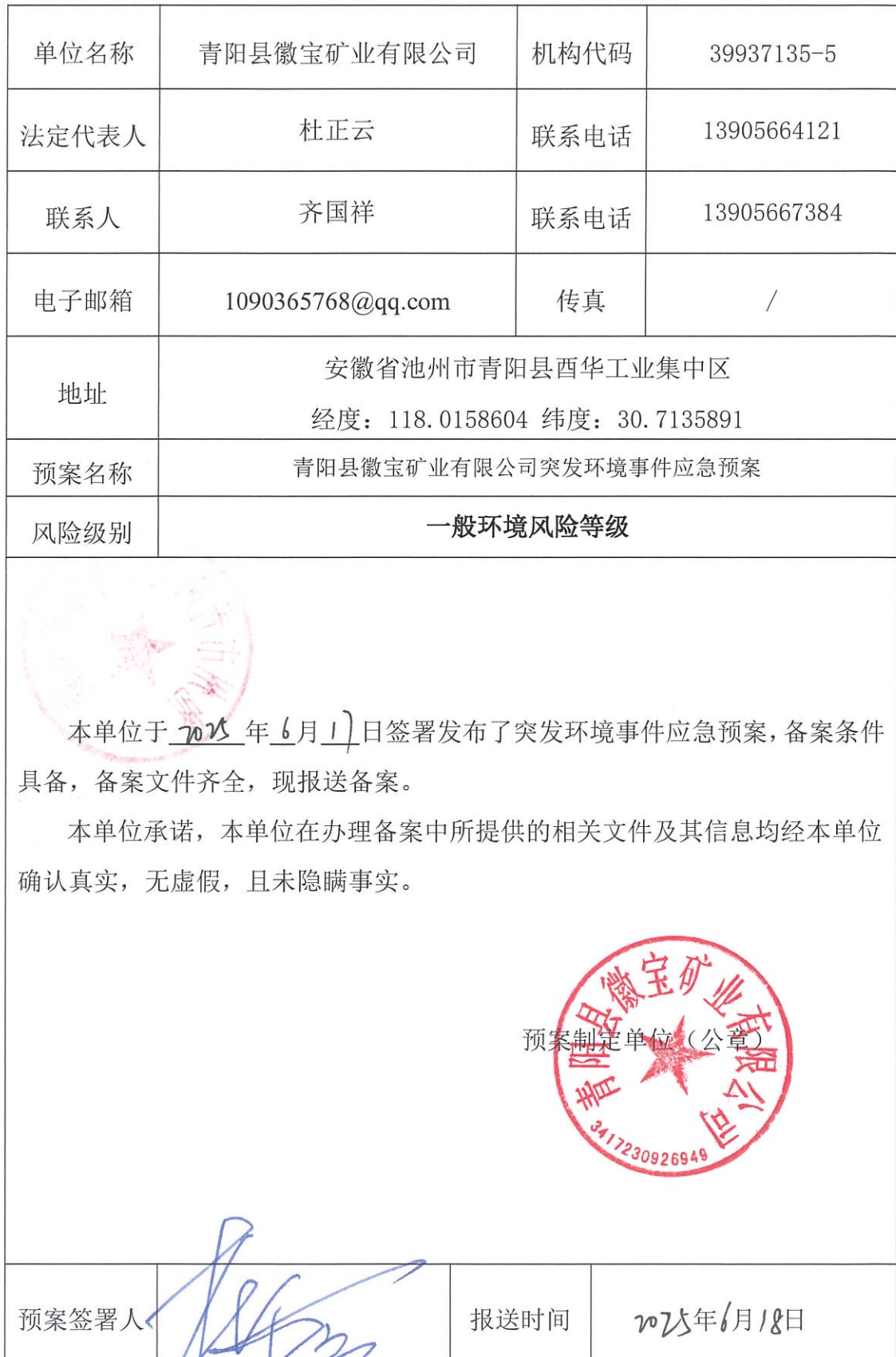
企业事业单位环境事件应急预案备案表