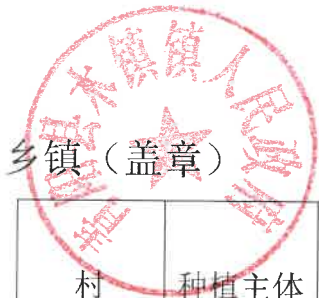
2024 年青阳县耕地轮作和扩种油菜乡镇自查验收表