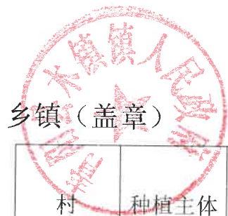
024 年青阳县耕地轮作和扩种油菜乡镇自查验收表