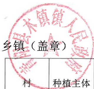
2024 年青阳县耕地轮作和扩种油菜乡镇自查验收表