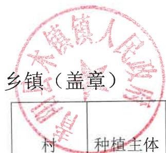
2024 年青阳县耕地轮作和扩种油菜乡镇自查验收表