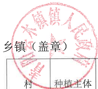
2024 年青阳县耕地轮作和扩种油菜乡镇自查验收表