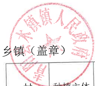
024 年青阳县耕地轮作和扩种油菜乡镇自查验收表