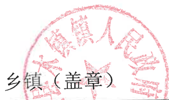
2024 年青阳县耕地轮作和扩种油菜乡镇自查验收表