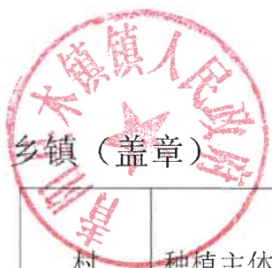
2024 年青阳县耕地轮作和扩种油菜乡镇自查验收表